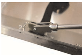
Befestigung am Akja